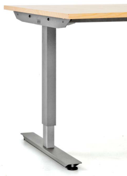
Stativ med rektangulære ben og T-fot.