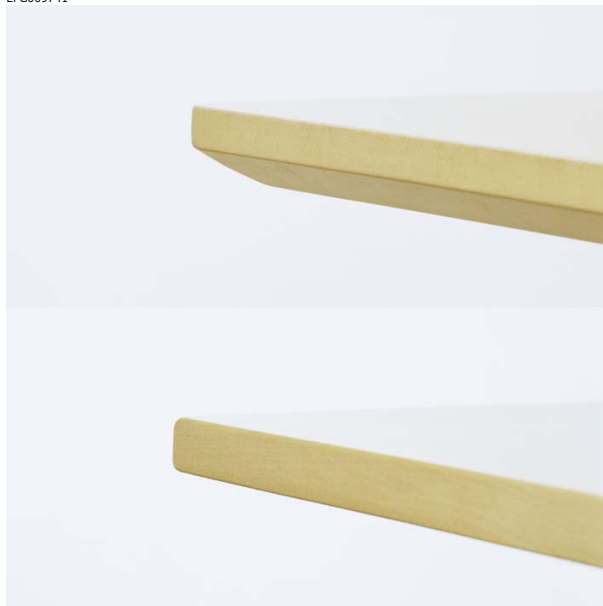
F-utførelse = faset kant, S-utførelse = rett kant