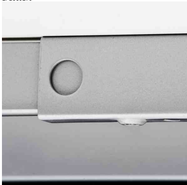
Trinnløs stillbar sarg