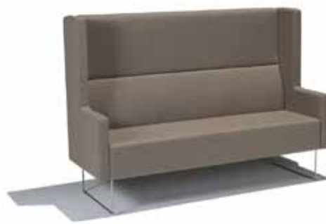
3-seter med L-vanger