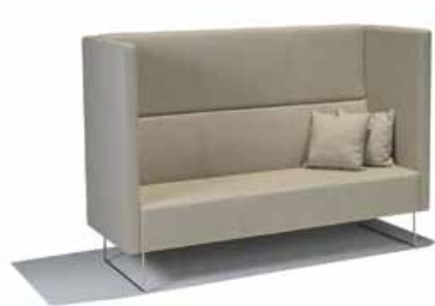
3-seter med standard vanger