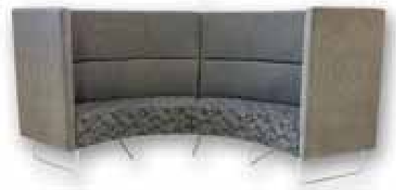
2 stk. 60 grader innvendig buer med standard vanger

Info: Leveres som 1-, 2-, 3-seter, stort og lite hjørneelement, samt 60 graders buer. Modellen leveres med ekstra høye vanger: hel, C- og L-form, samt endeplate. Tilbys i valgfritt stoff eller hud. Kan flammesikres. Stål: Ben leveres i blank krom i tre forskjellige høyder.