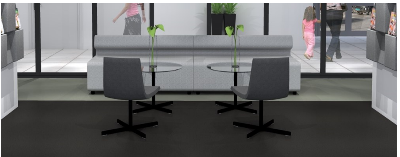
Clint Club stol