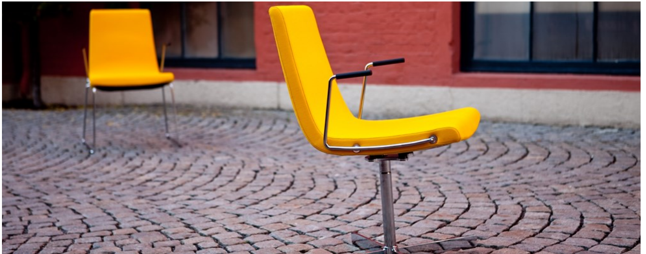
Clint Club stol