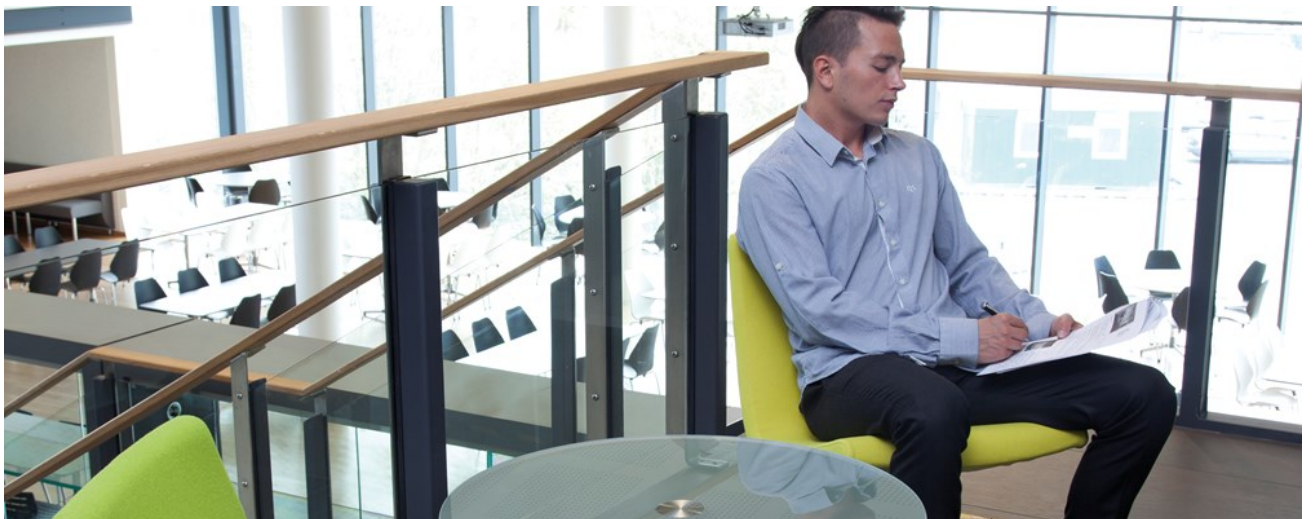
Clint Club stol og bord