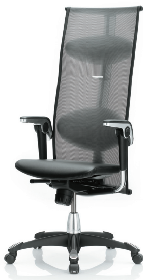
HÅG H09 Inspiration 9230