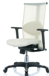
HÅG H09 Inspiration 9220