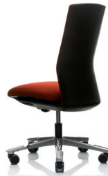
HÅG Futu 1020