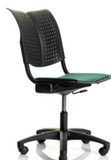
HÅG Conventio Wing 9822