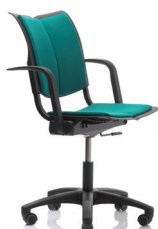
HÅG Conventio Wing 9832 m/armlene (ekstrautstyr)