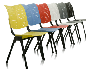
HÅG Conventio Wing 9811 i 6 forskjellige farger