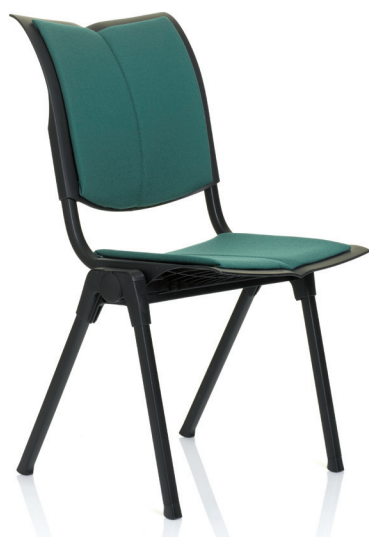
HÅG Conventio Wing 9831