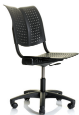
HÅG Conventio Wing 9812