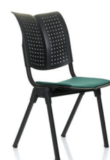
HÅG Conventio Wing 9821