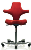
HÅG Capisco 8106