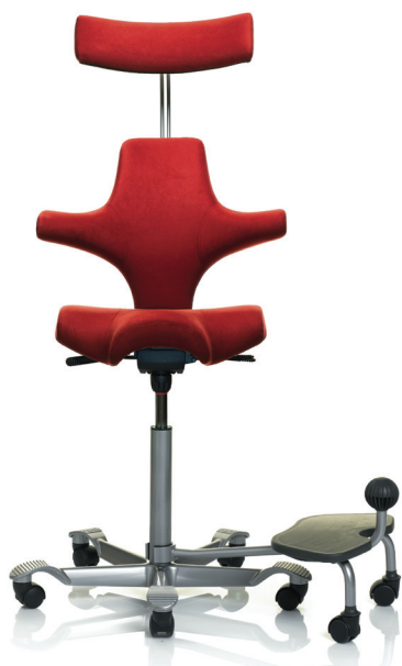
HÅG Capisco 8107 m/HÅG StepUp®