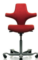
HÅG Capisco 8126