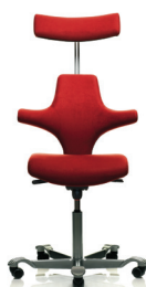
HÅG Capisco 8127