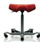
HÅG Capisco 8105