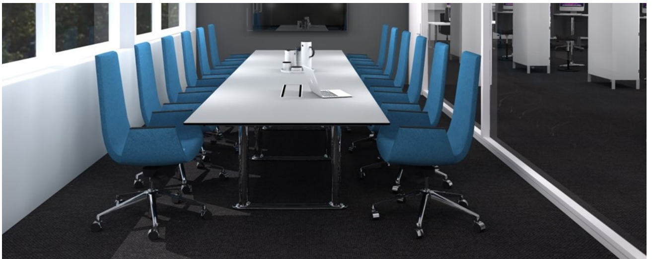
Møterom med Colonnade bord og Clint Vipp stoler.