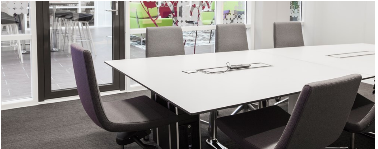
Clint Vipp stoler og Colonnade bord.