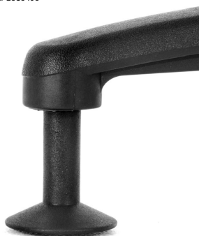
K05A51 - Glider