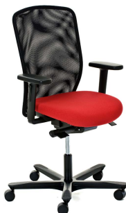
EFG Teamspirit 39 Synkron