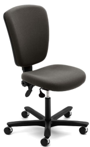
EFG Teamspirit 5